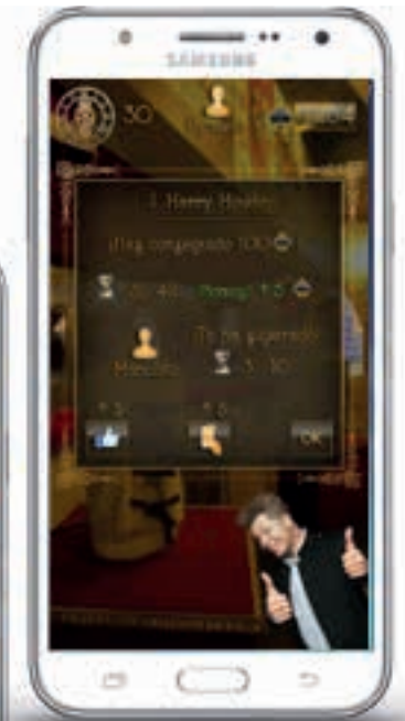
Magic Museum by Yunke