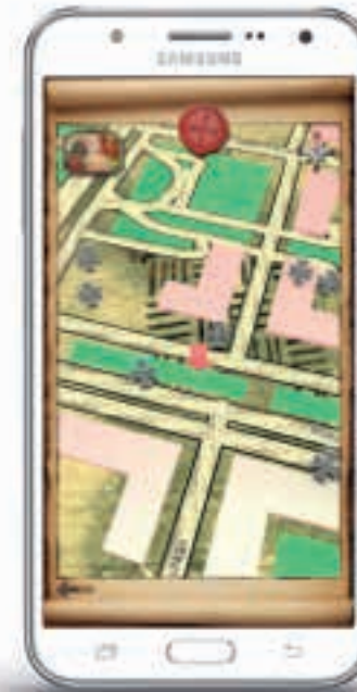
La Herencia del Temple - Alcalà de Xivert