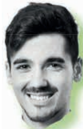
Javier Zapata Producción 360° G. Com. Audiovisual